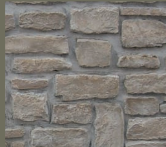
JURA KALKSTEIN RUSTIKAL, gespalten