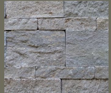
KIRCHHEIMER MUSCHELKALK, gespalten