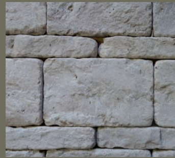
JURA KALKSTEIN, antik getrommelt