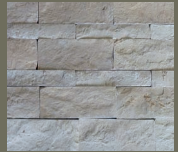
JURA KALKSTEIN, gespalten