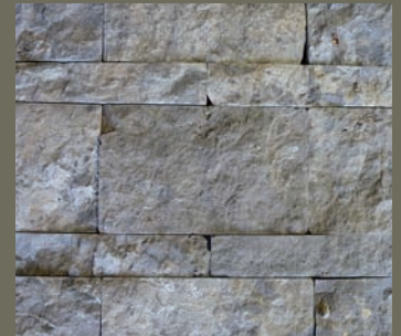
PFRAUNDORFER DOLOMIT, gespalten