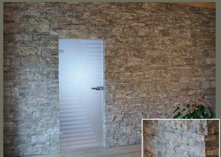
PFRAUNDORFER DOLOMIT SCHICHTVERBLENDER, gespalten mit Eckverblender