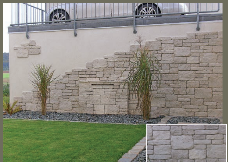
JURA SYSTEMVERBLENDER, getrommelt