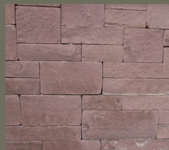
EICHENBÜHLER SANDSTEIN, antik getrommelt