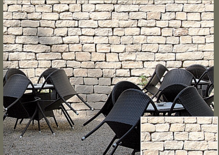
JURA MAUERSTEINVERBLENDER, gespalten

Eine große Auswahl heimischer Natursteine aus unseren Steinbrüchen ermöglicht auch eine Vielzahl individueller Lösungen.