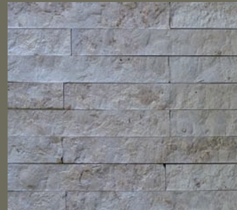
JURA KALKSTEIN, gespalten